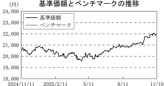
基準価額とベンチマークの推移

(注) ベンチマークは、期首（2024年11月11日）の値が基準価額と同一となるように指数化したものです。