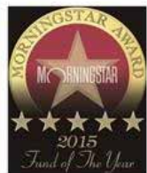
Fund of the year 2015

商号等 : 東京海上アセットマネジメント株式会社 金融商品取引業者 関東財務局長(金商)第361号 加入協会 : 一般社団法人 投資信託協会 一般社団法人 日本投資顧問業協会 一般社団法人 第二種金融商品取引業協会