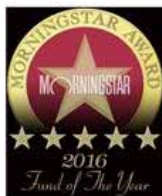
Fund of the year 2016